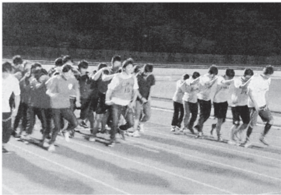
仲間と力を合わせて頑張りました

今回は初めてナイターで開催し、新種目としてジャベリックスローを実施しました。その結果、当日は若手教職員を中心に約1200人の参加があり、親睦を深めました。