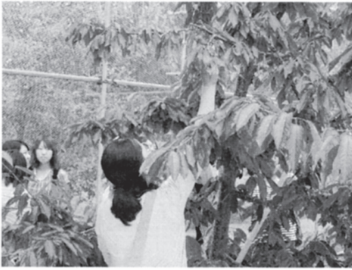
どの木がいちばん美味しいか味くらべ

まずは、山梨県白根町でさくらんぼ狩り。木によって味が違うので、あちらこちらの木からつまんで食べ、つまんで食べ。「木によってこんなに味が違うなんてビックリ!」「こんなにたくさんさくらんぼを食べたのは初めて!」と満足の声がたくさん聞か