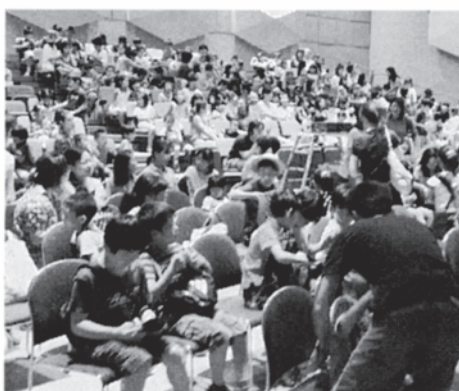
大盛況のハーモニーホール座間

どの会場でも、幼稚園・保育園児、小・中学生からおとなまで、あらゆる世代の方に来場していた