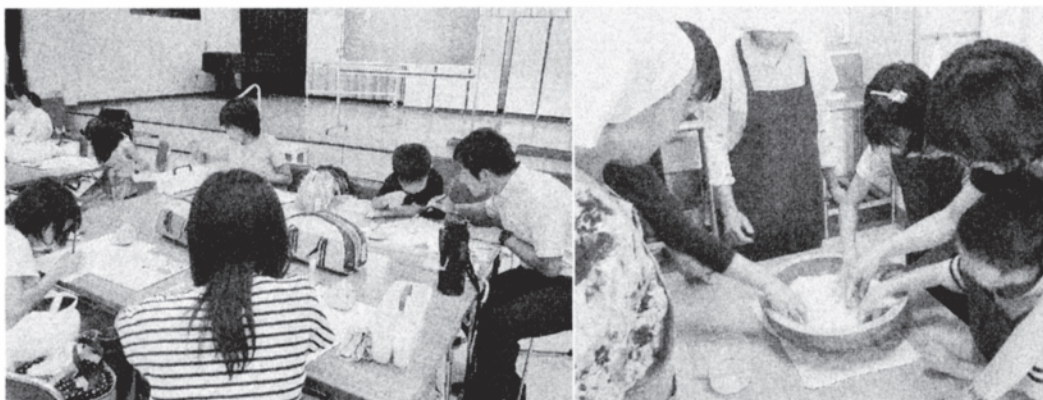
「ふれあいカルチャー」(左)と「ふれあいツアー」のひとこま

体制、しくみの変更があったものの、教育会館の役割は変わるものではありません。今後も設立の趣旨に従い、「地域の教育文化の拠点」という立場から、教職員の皆さん、地域の皆さんに貢献できる教育会館運営に努めて参る所存